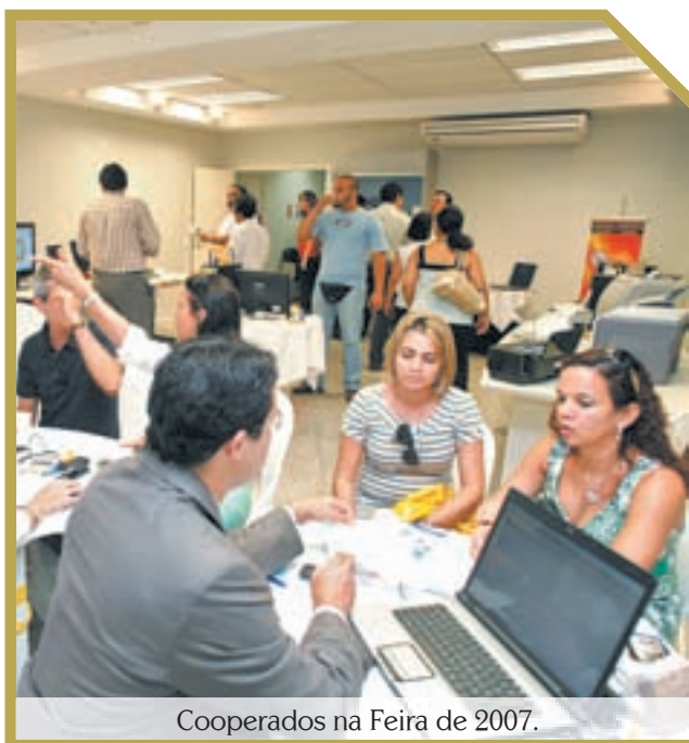
Cooperados na Feira de 2007.