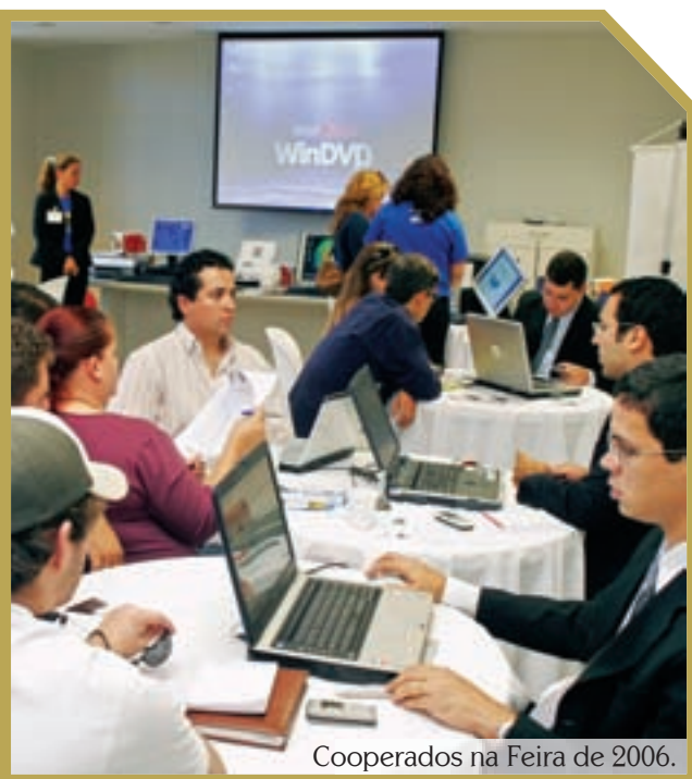
Cooperados na Feira de 2006.

ANO 1 . NÚMERO 3 . OUTUBRO/NOVEMBRO 2007 . NATAL-RN